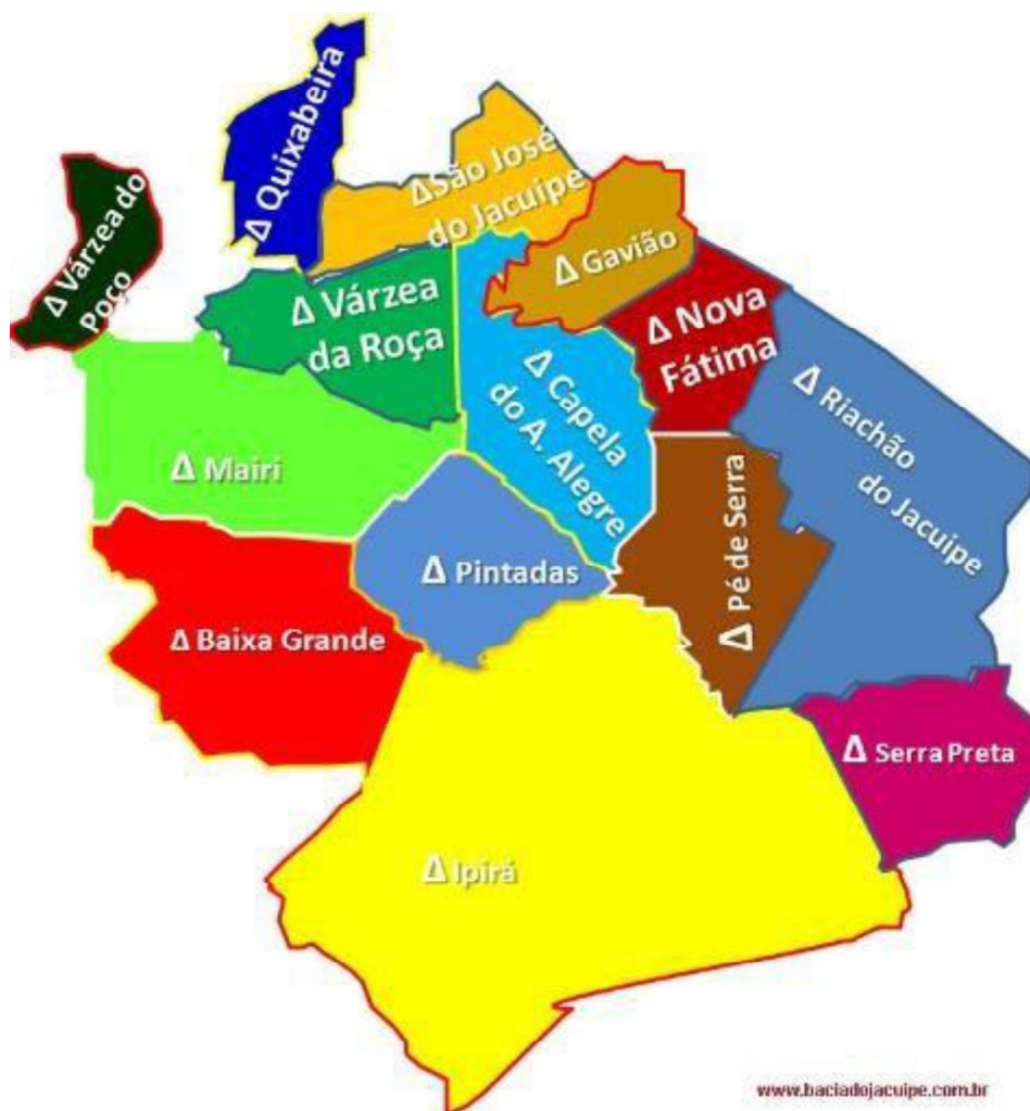
Figura 1 – Bacia do Jacuípe

Fonte: Território Bacia do Jacuípe, 2018